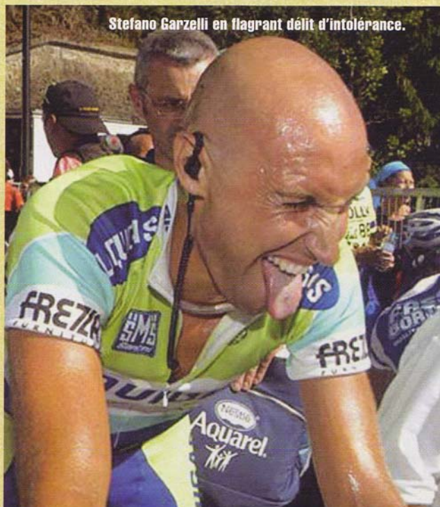
Stefano Garzelli en flagrant délit d'intolérance.